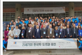
'18년 한국학비엔날레 기념촬영