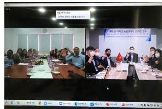
베트남 다락성 농업분야 공무원 연수