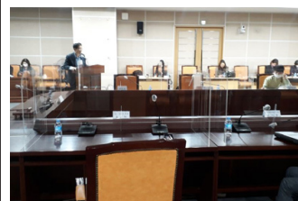
남북교류 특강 2(양재석 센터장)