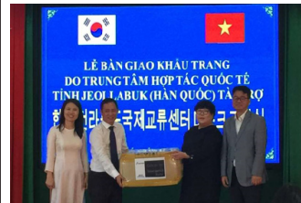
베트남 닥락성 방역물품 전달식(온라인)