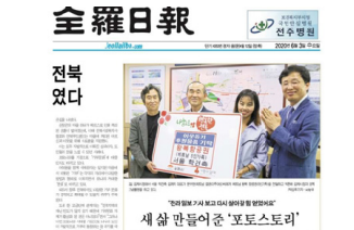
독자후원연계 '포토스토리' 기사