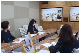
일본 가고시마현 비대면 교류회의