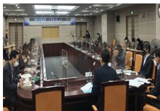
다문화실태조사 용역 중간보고회