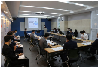
코로나19 대응 국제교류 자문회의