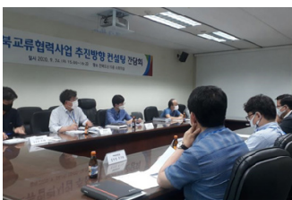
남북교류협력사업 컨설팅 회의