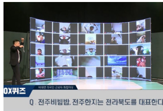
비대면 외국인 화합마당(이벤트퀴즈)