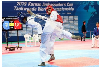
'19년 대사배 태권도대회 경기장면