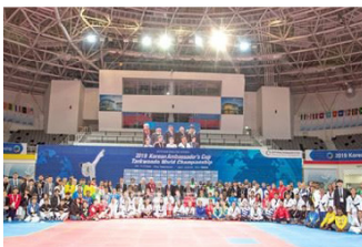
'19년 대사배 태권도대회 기념촬영